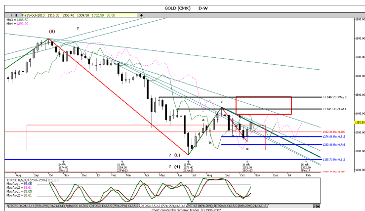
Gold. Time Frame: Daily

Come anticipato nelle passate settimane, il movimento del Gold Future è inserito in uno "zig-zag" tipico dopo grandi escursioni di prezzo come quelle a cui abbiamo assistito nel periodo compreso tra ottobre 2012 e giugno 2013.