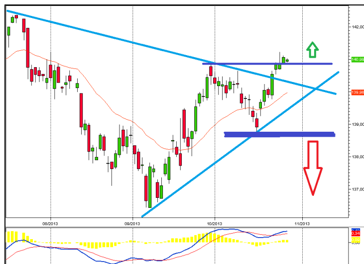
Bund Future. Time Frame: Daily.

Nell'ultima settimana, la debolezza e l'incertezza che hanno accompagnato l'andamento delle principali Borse azionarie ha inciso positivamente sulle quotazioni del BUND. Dopo un mese di settembre molto positivo, con i prezzi che sono passati dal minimo di 136,42 ad un massimo relativo a quota 140,87, successivamente l'obbligazionario tedesco ha realizzato anche una "configurazione a V", che ha visto un immediato ritorno oltre l'area 141. Dal punto di vista prettamente tecnico, ora l'impostazione del mercato sembra essere diventata positiva nel breve/medio periodo, in quanto sono state superate al rialzo sia la resistenza dinamica tracciabile al massimo dello scorso luglio, che quella statica proprio sul livello 140,87, ma sarà necessario valutare attentamente la bontà di questo segnale di acquisto anche alla luce delle più importanti condizioni macroeconomiche. Di sicuro, il mercato non è negativo e non dovranno essere aperte posizioni short o di copertura prima della violazione del livello 138,78.