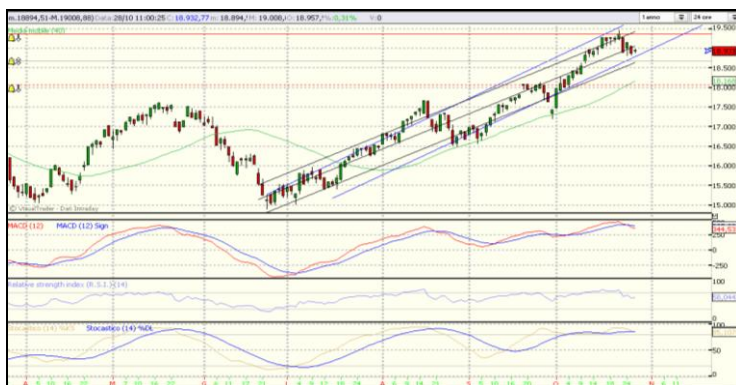
Ftse/Mib. Time Frame: Daily.

Il principale indice italiano continua a muoversi all’interno del canale ascendente di medio periodo, delineatosi dall’estate, ma registra i primi segnali di debolezza di breve periodo e si allontana dall’area di ipercomprato, perforando al ribasso i 19.000 punti. Attualmente è individuabile un supporto a 18.700 punti; l’eventuale rottura di tale livello proietterebbe l’indice verso i 18.000 punti. Solo il superamento della barriera posta in area 19.450 annullerebbe lo scenario ribassista previsto per il breve periodo.