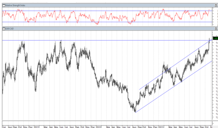
Eur/Cad. Time Frame: Daily

Il cross valutario tra Euro e Dollaro canadese ha mostrato la scorsa settimana uno spunto interessante. Al culmine di un trend rialzista che dura ormai da oltre un anno, l’Euro ha superato anche l’importante resistenza di area 1,44, che nel 2010 e 2011 aveva già più volte respinto le velleità rialziste della moneta unica. Tuttavia dobbiamo notare che il superamento è avvenuto in condizioni di significativo ipercomprato, come si può rilevare dall’indicatore RSI(14), che ha raggiunto quasi il valore di 77 e dal fatto che sia stato superato il bordo superiore del canale rialzista che guida tutto il movimento partito nell’agosto 2012. Pertanto il rialzo potrebbe aver vita breve e dovrebbe essere seguito da un movimento di pull-back, che potrebbe poi favorire in seguito il definitivo sfondamento, sempre che nel frattempo non sopraggiungano elementi di incertezza tali da mutare il sentimento degli operatori.